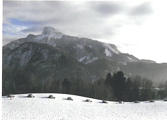
5 Richard Nonas-Stoneline, 1999 Innerschwand, Abfahrt von der Bundesstraße Mondsee-Unterach beim Hotel Seehof (Gemeinde Innerschwand-Loibichl) auf dem Güterweg Seehof, ca. 300 m