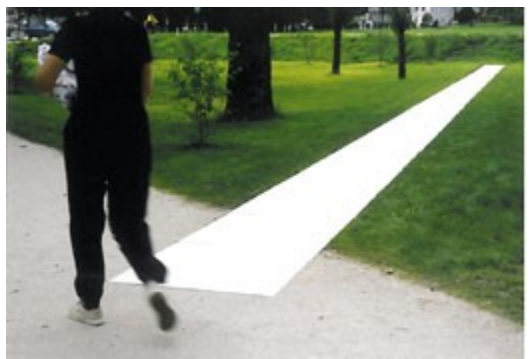
Karl-Heiz KLOPF, Einmal 40

Aus diesem Grund wurde von derselbigen eine namhaft besetzte Jury beauftragt, Künstlerinnen und Künstler für die jeweiligen Standorte zu gewinnen bzw. einen internationalen Standort auszuschreiben. (Details finden Sie im Folder Landart)